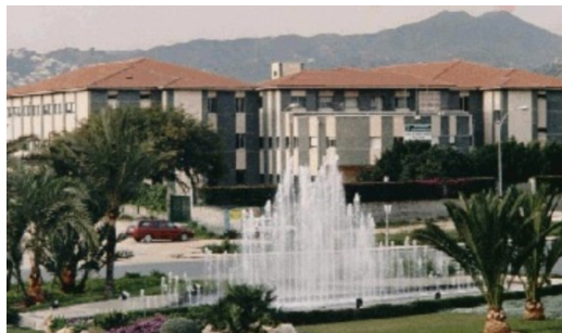
Junto al parque empresarial Santa Bárbara